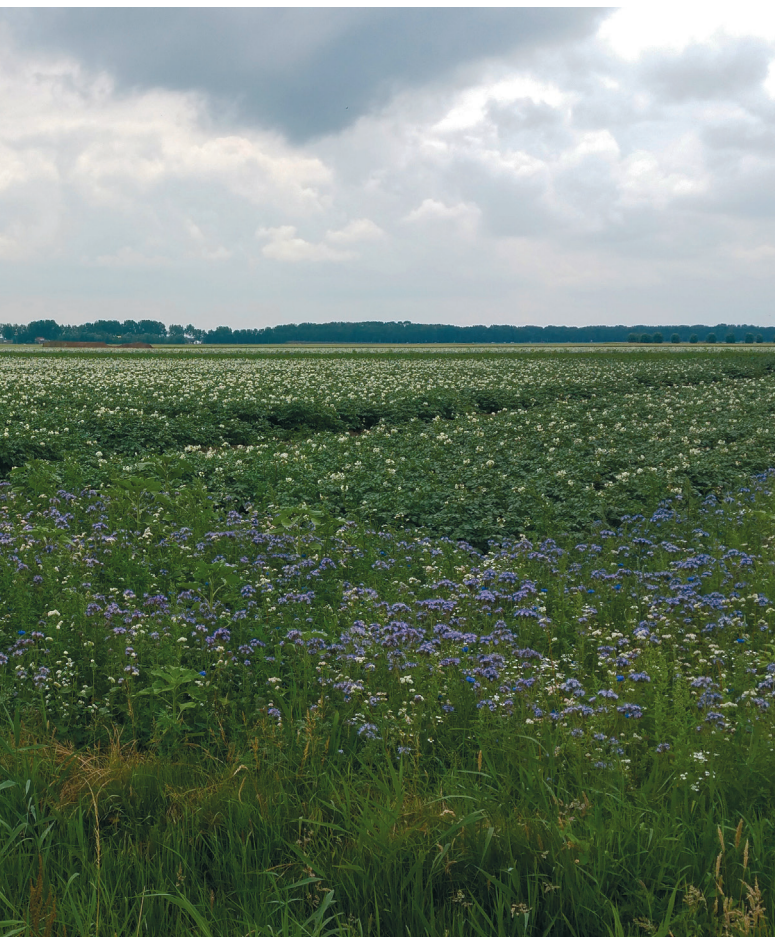
Kruidenstrook: Hilde Wiegerinck

Inzaai van kruidenrijke randen is best een investering: goed zaad is vrij duur. Hieronder vindt u advies over het voorkomen van onkruid en niet opkomend zaad.