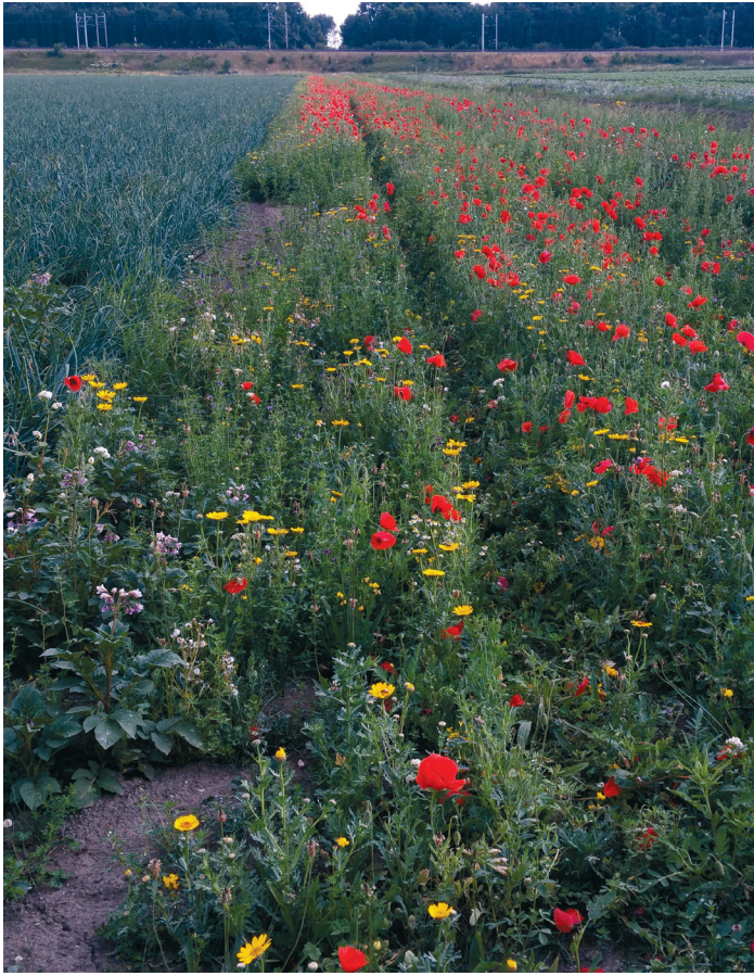
Kruidenstrook klaprozen: Hilde Wiegerinck

dat er zorgvuldig en niet te diep gezaaid wordt. Bij kleine oppervlaktes werkt zaaien met de hand heel goed: vermeng het zaad met zand, en strooi dit gelijkmatig over de oppervlakte uit. Mengen met zand is handig om te voorkomen dat u te dicht zaait. Bijkomend voordeel is dat u met zand goed kunt zien waar u gezaaid heeft. Bij een hoge onkruiddruk kunt u de bloemenrand (type eenjarig bloeiend mengsel) ook in rijen zaaien. Hierdoor kunt u na opkomst van vegetatie tussen de rijen schoffelen.