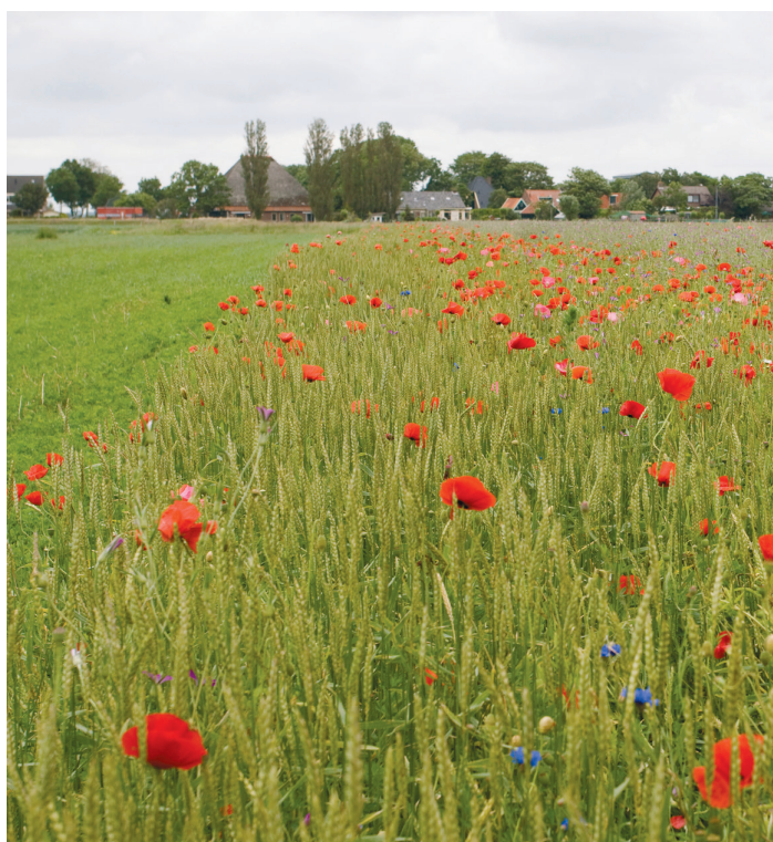
Kruidenveld klaprozen: Danielle Lieuwen

Daarnaast zijn er specifieke beheervoorwaarden voor perceelranden op grasland en die op bouwland, bollenland en tuinland. Hieronder wordt eerst ingegaan op grasland. Daarna vindt u informatie over de beheervoorwaarden van bouwland, bollenland en tuinland.