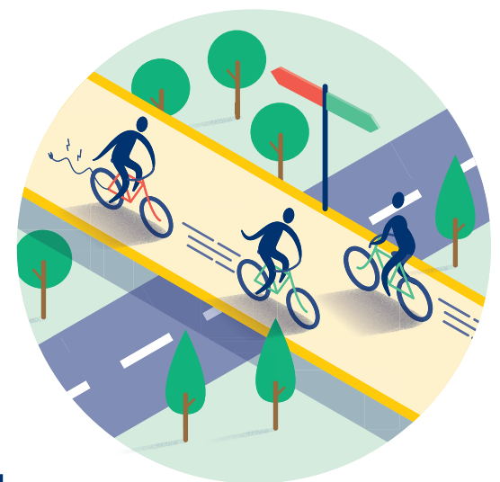
Fietsroutes en -netwerk