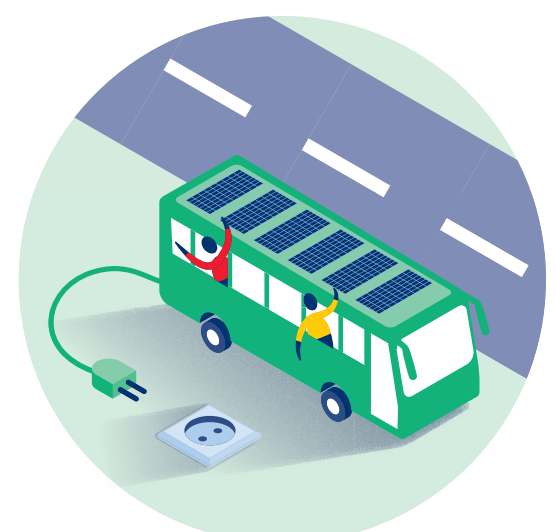
Duurzaam openbaar vervoer