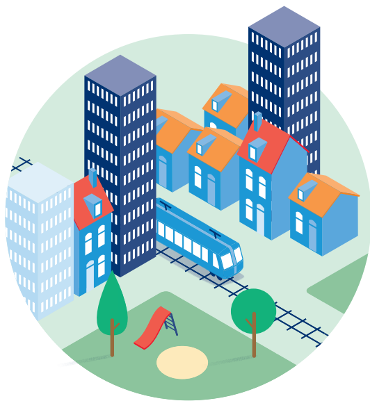
Verdichten steden en dorpen / autoluw