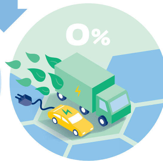
ZERO Emissie Zones