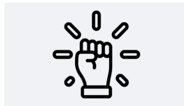
Besluitvaardig en daadkrachtig