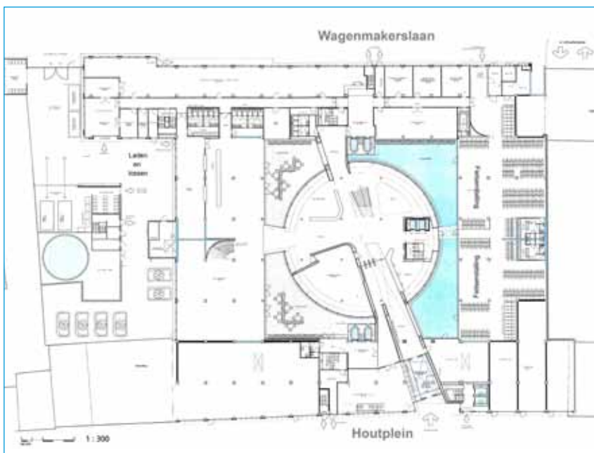
Definitief ontwerp: plattegrond begane grond

Op dit moment wordt gewerkt aan het technisch ontwerp (bestek en technische tekeningen), ter voorbereiding op de Europese aanbesteding om een aannemer te selecteren. Ook zijn we gestart met het opstellen van de bouwaanvraag, die nodig is voor het aanvragen van een bouwvergunning. Naar verwachting starten de voorbereidende werkzaamheden voor de bouw in de herfst van 2010.