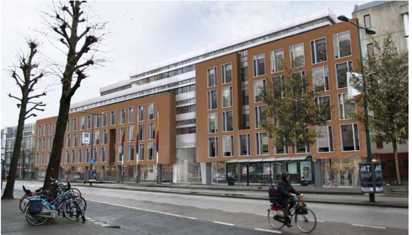
Impressie van de nieuwe voorgevel aan het Houtplein

van de Wagenmakerslaan veranderd. Eerder waren aan deze zijde magazijnen ingetekend. Nu zijn er langs de buitengevel werkruimten voor de facilitaire dienst gepland. Dat betekent dat er van buiten meer levendigheid in het pand te zien is; een wens van de omwonenden aan de Wagenmakerslaan. Een andere wijziging is dat de fietsenstalling wordt verplaatst van de kant van de Gasthuissingel naar de kant van het