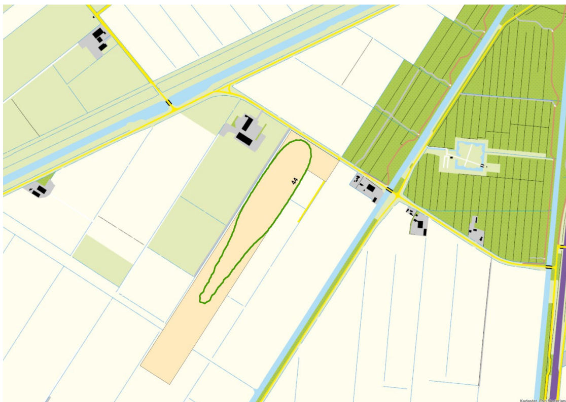
figuur 2 contour van L_{den} = 44 dB. De 56 dB contour L_{den} ligt hier binnen. Het oranje vlak is het terrein van de club.

Uitgaande van 250 starts per jaar is de L_{den} berekend. In figuur 2 is de contour van L_{den} = 44 dB weergegeven, die op het breedste gedeelte samenvalt met de terreingrens van het vliegveld. De L_{den} = 56 dB contour is te klein om nauwkeurig te kunnen berekenen, maar ligt natuurlijk volledig binnen de 44 dB contour en valt daarom ook ruim binnen het terrein van het zweefvliegveld.