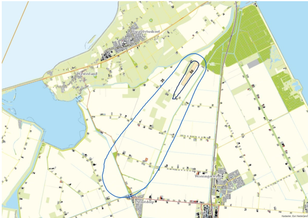
figuur 3 contouren van L_{Aeq,24h} = 35 \text{ dB(A)} en 50 \text{ dB(A)}

Een specifieke te beoordelen parameter in de PMV is het geluidsniveau op 50 m afstand. Omdat de positie van een startend vliegtuig natuurlijk niet vast is, hebben we ervoor gekozen het L_{Aeq,24h} niveau op 50 m buiten het grondpad in kaart te brengen.