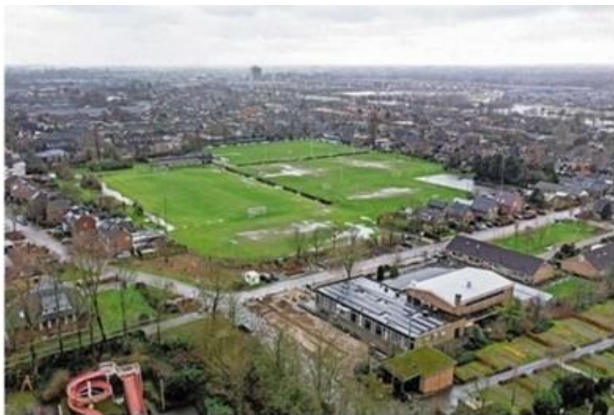
Sint Pancras vanuit de lucht met rechtsonder dorpshuis De Geist.