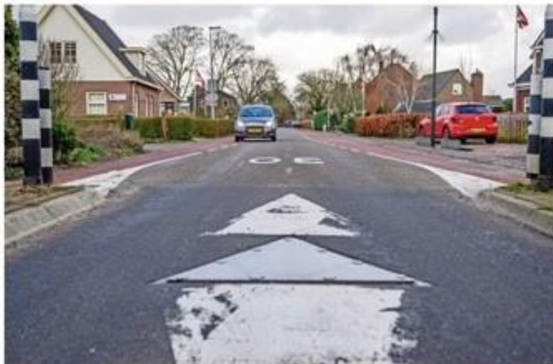
De proef om het paaltje omlaag te doen, gaat door.

Kansel de jaren geleden werd hier al over ghabkheid. De Raad