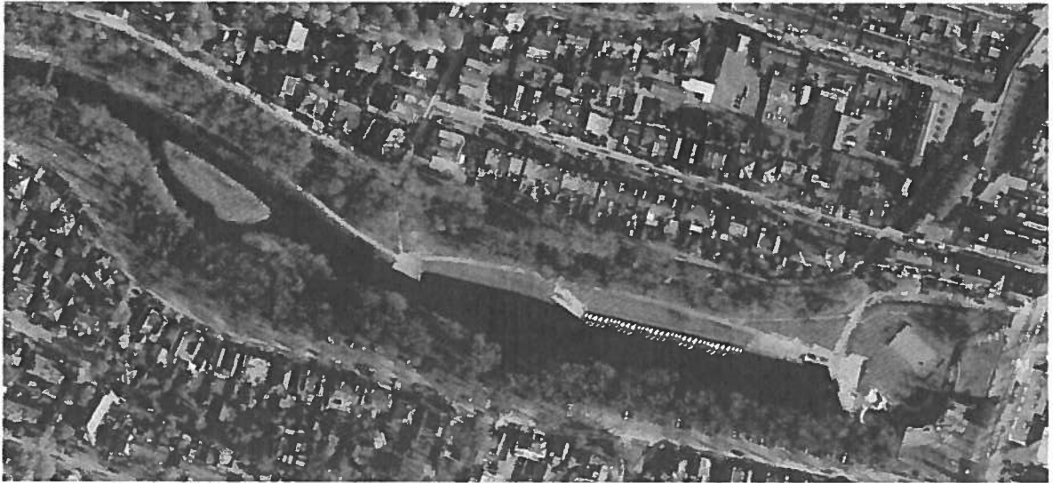
View of the Hiverium's Canal - (Ude Hiverium)