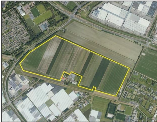
Stimuleringsgebied zonne-energie Boesingheliede