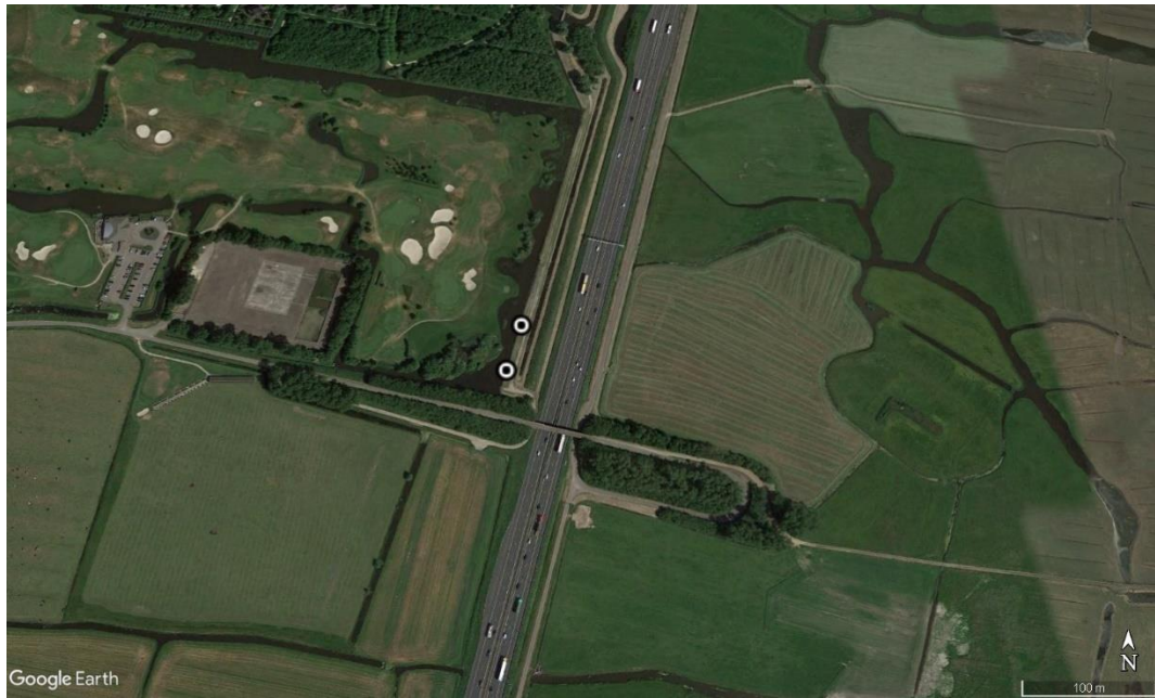
Locaties vleermuiskasten ten noorden van de Lagelaan