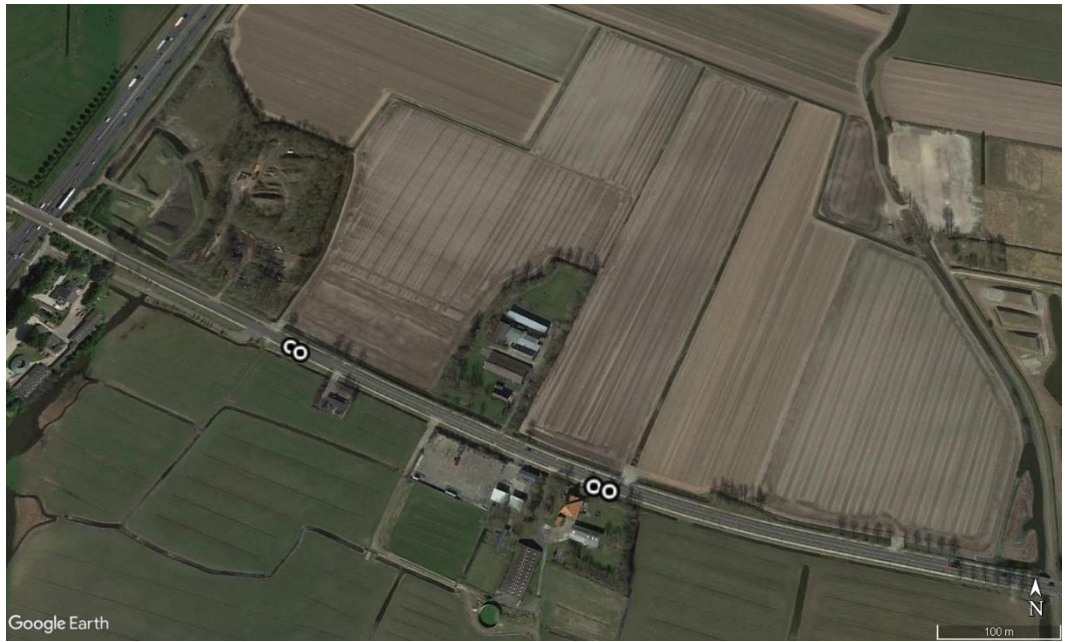
Locaties vleermuiskasten langs de Kanaalweg