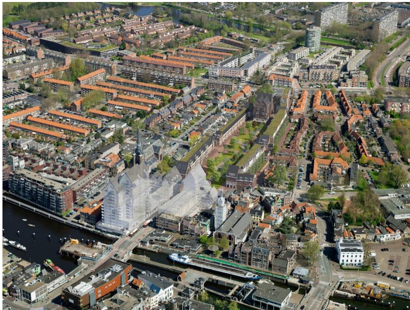
Zaandam – plannen Peperstraat en omgeving