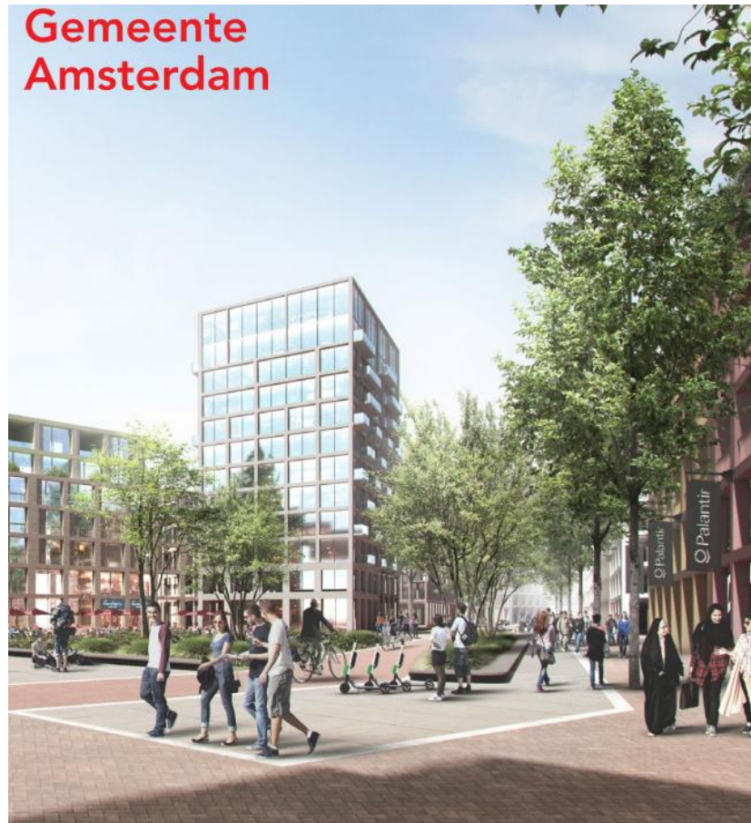
Visualisatie Schinkelkwartier, Amsterdam