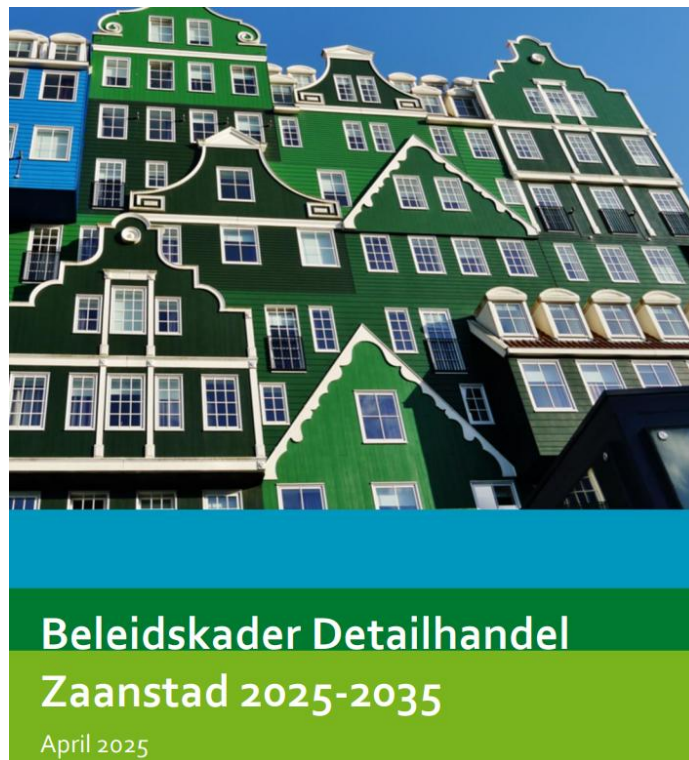
Beleidskader Detailhandel Zaanstad 2025 – 2035