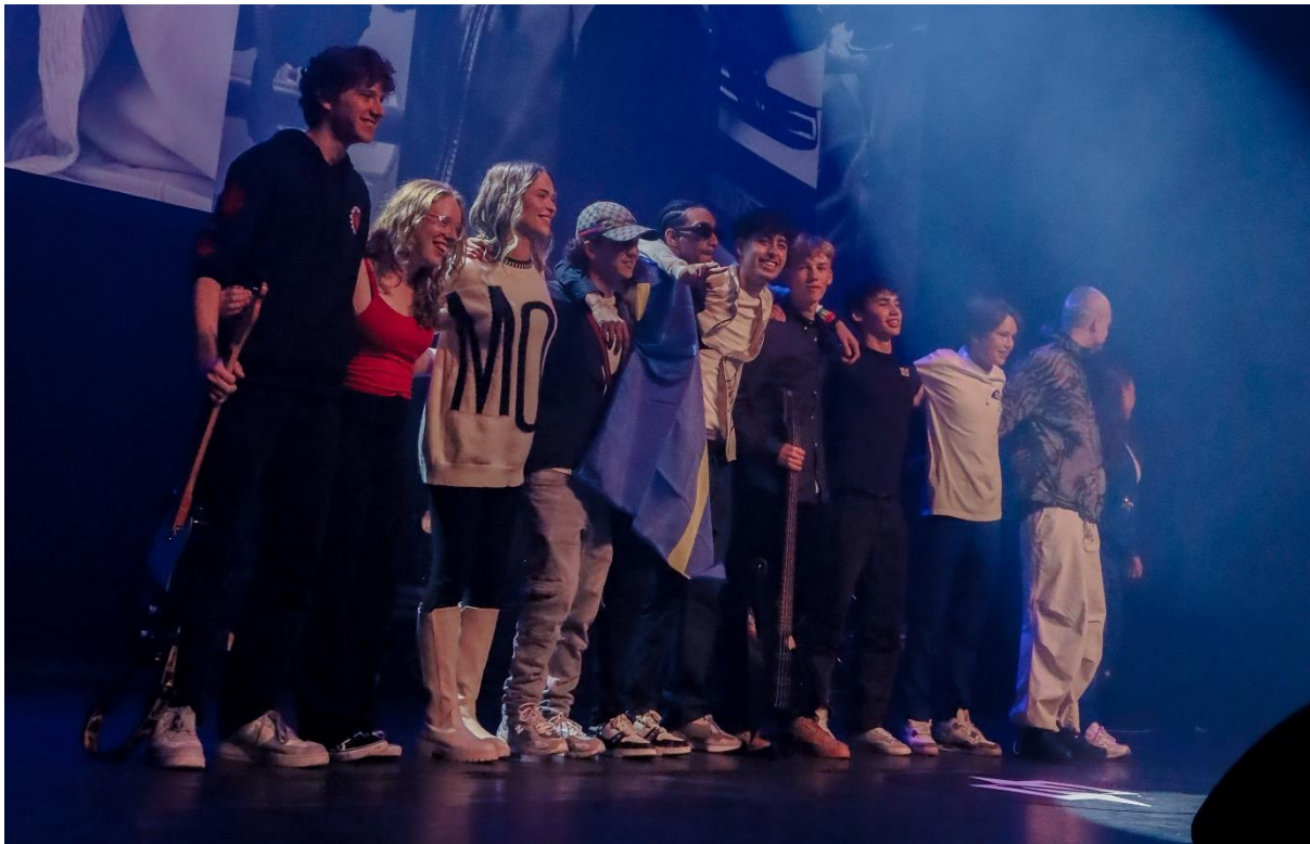
(Next Up -Triple Threat & Stadsschouwburg/Phil Haarlem)

Het SPUK-budget is volledig opgemaakt. De gelden in 2022 alsook de regeling in 2023-2024 werden aanzienlijk overvraagd waardoor strakke keuzes moesten worden gemaakt.