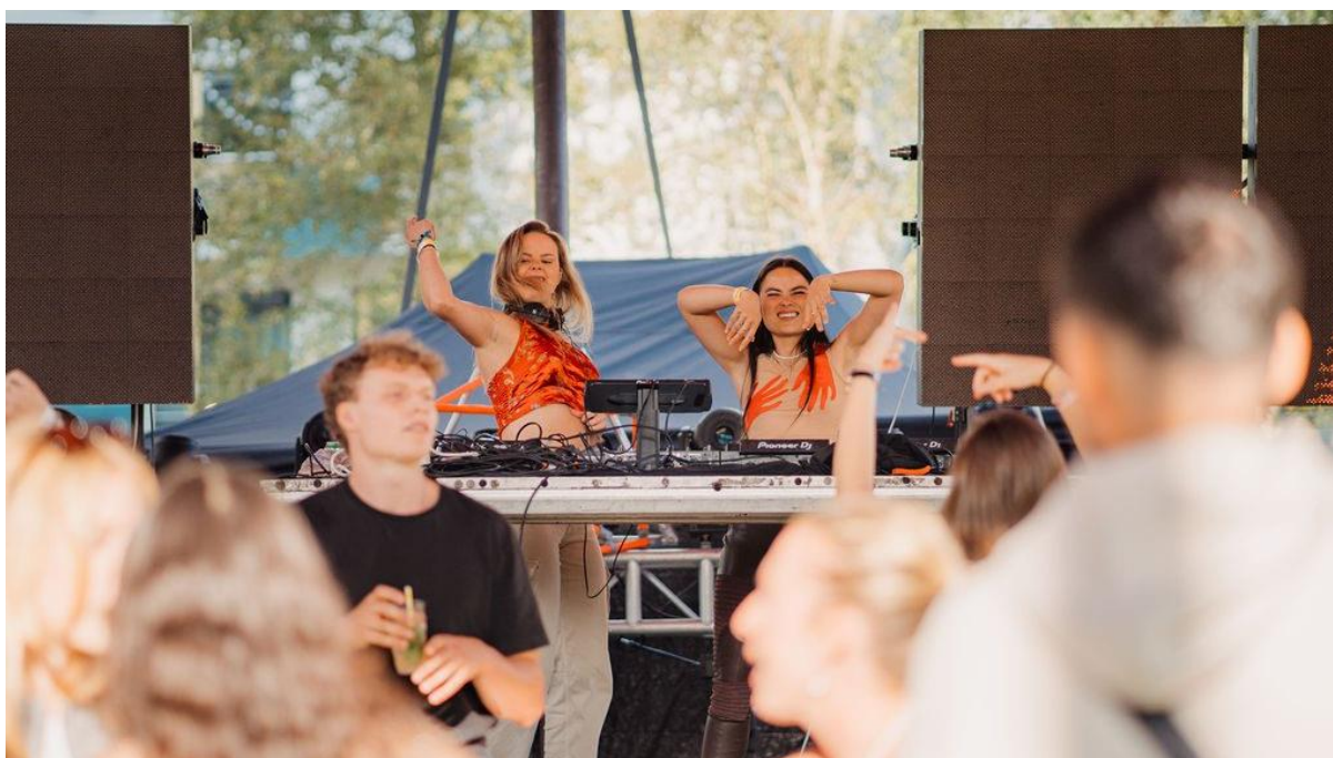
(FocusOn, Uilenkatten (thuisfront))

In 2022 is deze regeling exclusief aangeboden aan zeven organisaties die al een subsidierelatie hadden met de gemeente. In het portaal van de gemeente is een formulier aangemaakt dat instellingen moesten invullen met doelstellingen en een beschrijving van de activiteit. In 2023 en 2024 is de regeling steeds breder uitgestuurd, waardoor andere initiatiefnemers, die nog niet in beeld waren bij de gemeente ook een aanvraag konden indienen.