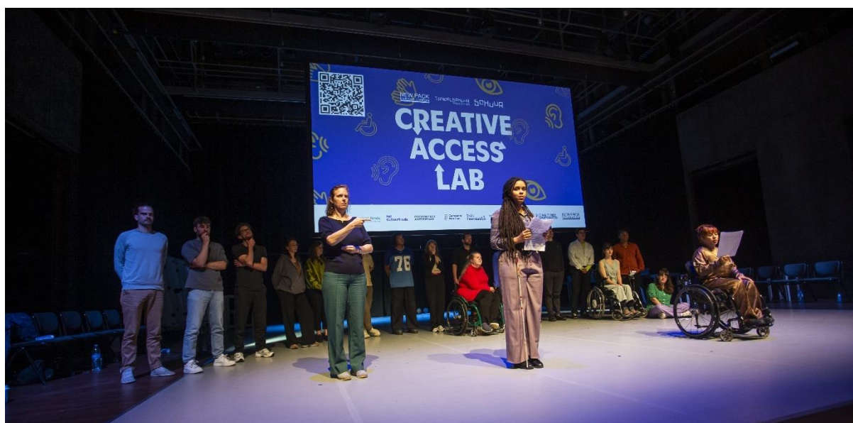
(Creative acces lab – De schuur Haarlem)

In de gemeente Haarlem zijn de SPUK-gelden besteed met als doel het investeren in nachtcultuur en talentontwikkeling van jongeren in de leeftijd van 18 jaar en ouder. De focus lag daarnaast op festivals en activiteiten met een ruim bereik. In 2022 heeft de gemeente, gezien de beperkte tijd die er was om een regeling in te richten, een aantal partijen direct benaderd om een aanvraag in te dienen. Deze partijen zijn benaderd vanwege o.a. hun ervaringen met de doelgroep, expertise en netwerk in de stad. De aanvragen van deze partijen zijn op basis van de plannen gehonoreerd. Voor 2023-2024 is er wel een regeling ingericht, mede onder de aandacht gebracht van relevante doelgroepen door de culturele instellingen die het jaar daarvoor geld hebben gekregen om extra activiteiten op te zetten. Deze regeling heeft een open en laagdrempelig karakter. Bij het opstellen van de regeling is geput uit- en voortgebouwd op de recent aangenomen Nachtvisie 2 . Ook is er veel aandacht besteed aan het laten participeren van jongeren, dus een bottom-up werkwijze vanuit de vraag en behoefte van de doelgroepen.