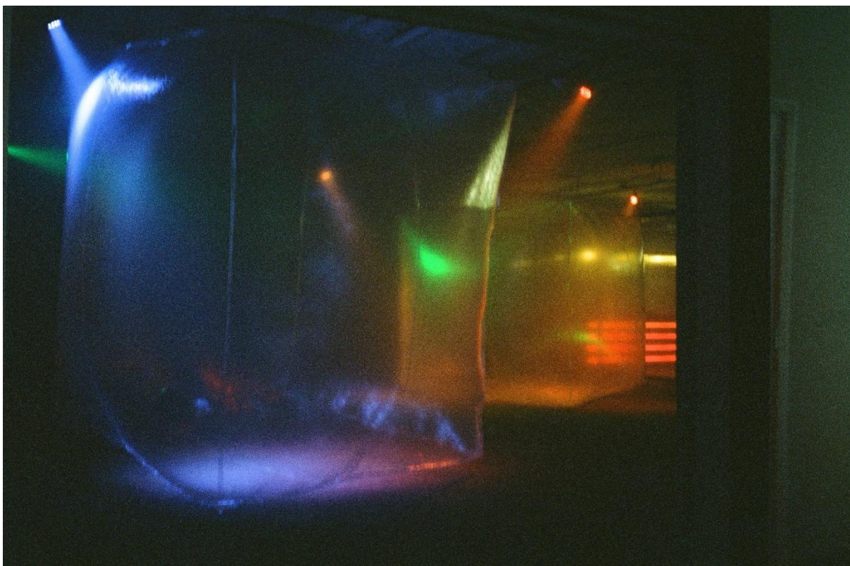
(Lucia Fernandez Santoro, Eternal Return (Iteration #2))

Er zijn over de hele linie met name aanvragen gedaan door kunstenaars en culturele instellingen met een speciale focus op jongeren. Ook enkele maatschappelijke organisaties in het sociale domein hebben aanvragen ingediend, maar zij hadden wel al in eerdere projecten een link met cultuur gemaakt.