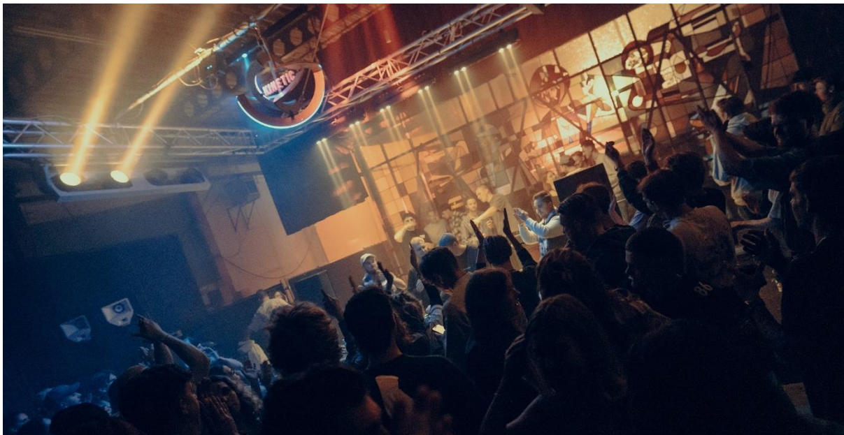
(shotbySe7en, KINETIC indoor festival)

De subsidieregeling had als richtlijn dat de toegekende activiteiten georganiseerd en geconsumeerd moesten worden door jongeren, met de insteek dat de professionele schil van organisaties niet volledig de touwtjes in handen zouden nemen. Er werd in de aanvragen gekeken of een cultureel component aanwezig was en of jongeren elkaar door middel van cultuurparticipatie zouden ontmoeten. Als doelgroep werd jongeren van 14 t/m 27 jaar aangehouden.