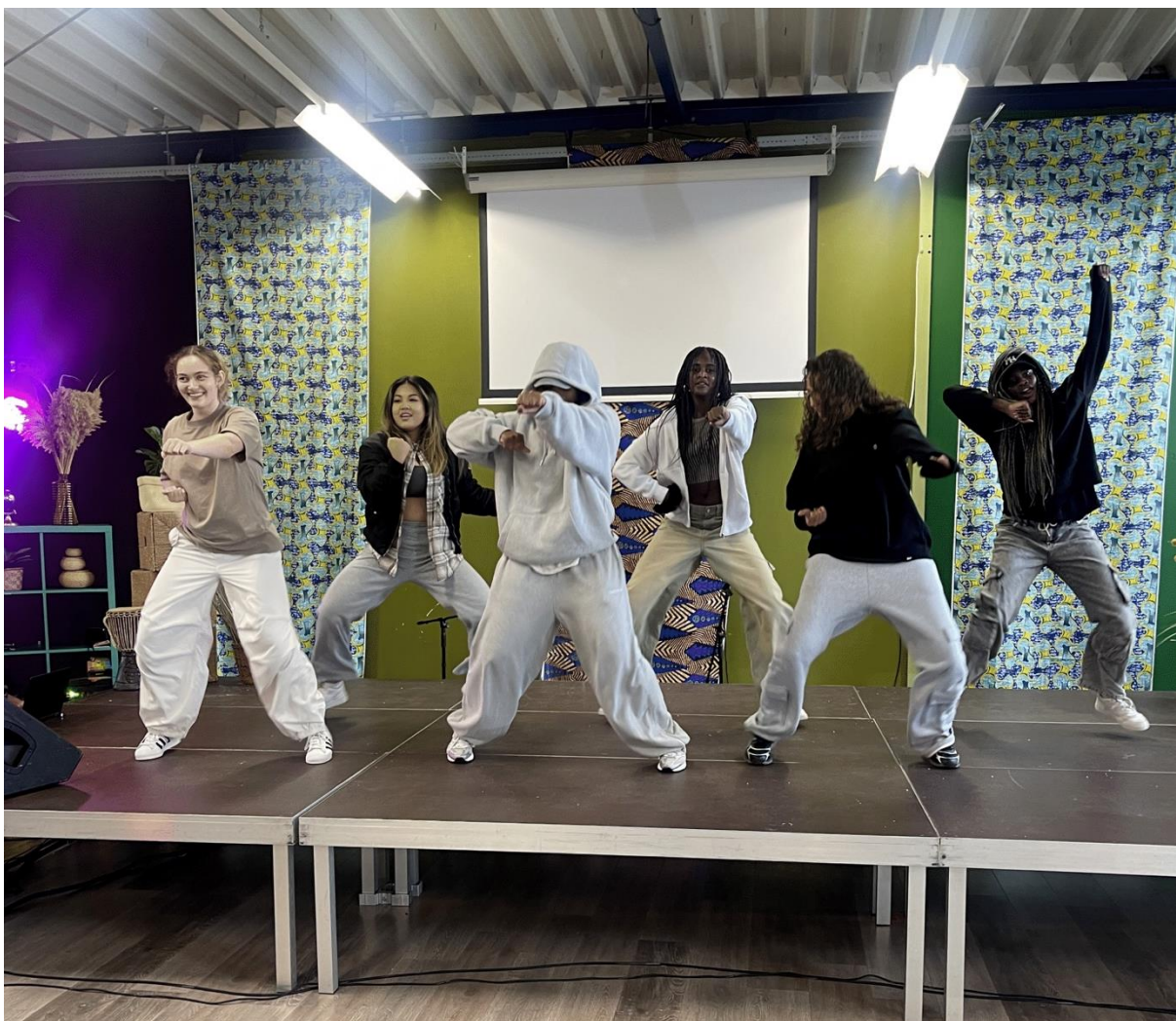
(Black Wall Street)

Binnen de pilot hebben genoemde organisaties hebben o.a. een nieuwe plek voor cultuurdeelname door en voor jongeren gecreëerd, festivals en workshops georganiseerd, talentontwikkelingsprojecten aangeboden, samengewerkt met het sociaal wijkteam en de podia voor jongeren een impuls gegeven. Inhoudelijk was er o.a. aandacht voor crossovers tussen street art, ondernemen, mode en muziek; het gedeelde erfgoed van Suriname en Nederland en het laten excelleren en zichtbaar maken van een groep getalenteerde jonge, beginnende en opkomende creatievelingen en kunstenaars uit Zaanstad.