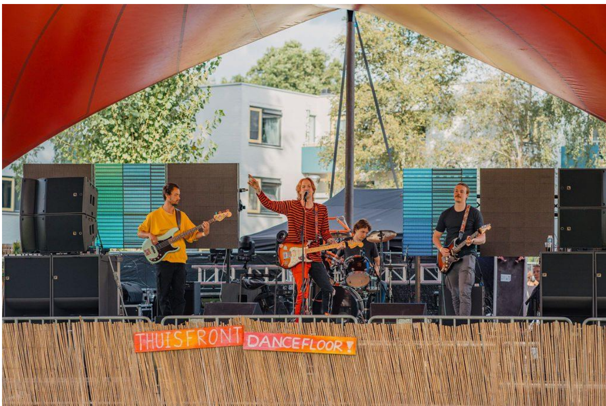
(FocusOn, Uilenkatten (thuisfront))