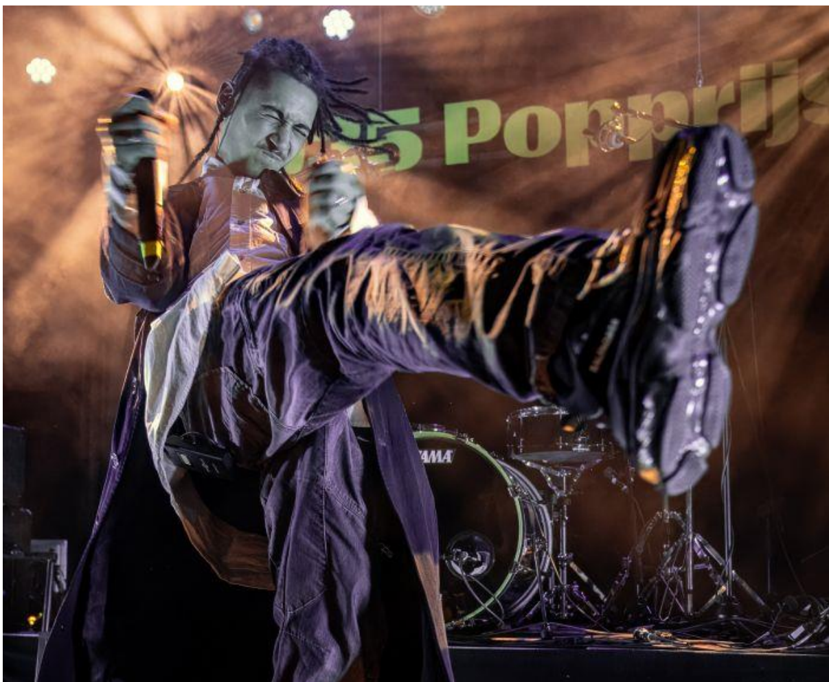
(035 popprijs – Morel)

Wat betreft communicatie, is er een kleinschalige campagne opgestart om jongeren te bereiken om zelf initiatieven op te zetten.