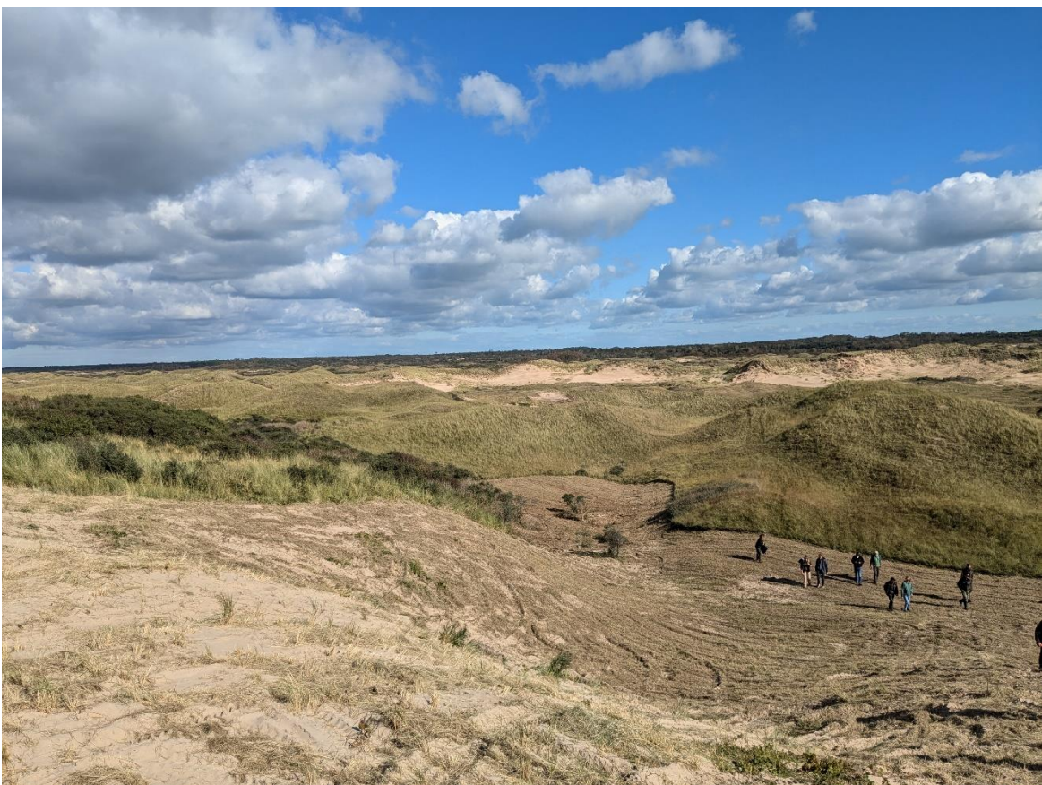
Figuur 5 - locatie 3: bovenop kerflocatie, in de verte het Lazaretduin.