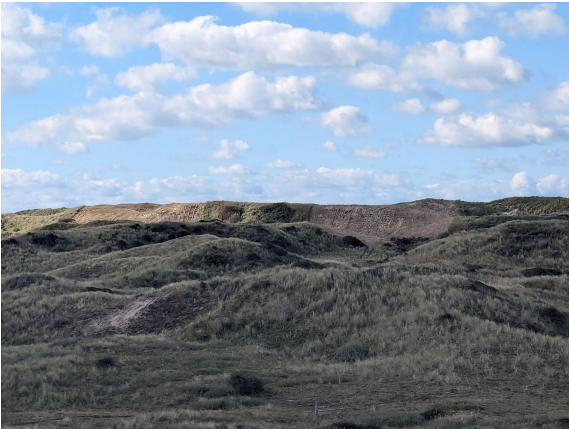
Figuur 4 - locatie 3: in de verte de gemaaide zeereep waar kerven worden aangelegd.