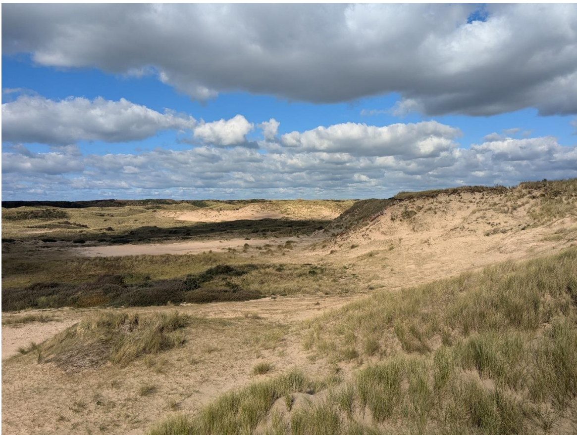
Figuur 3 - locatie 3: Lazaretduin. Het paraboolduin wordt weer vrijgemaakt van vegetatie om verstuiving op gang te brengen.