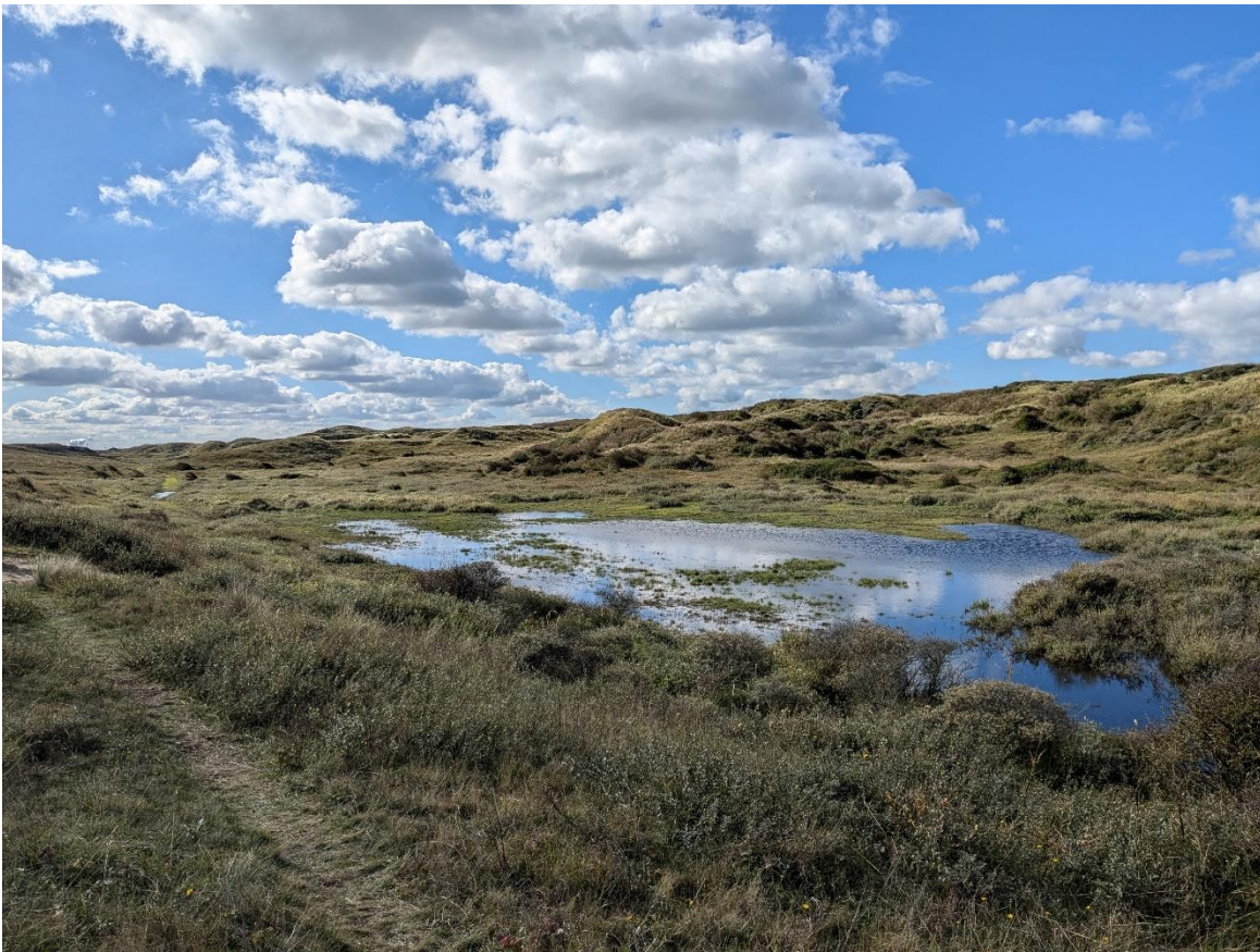
Figuur 2 - locatie 2: hoog water waar normaal het pad loopt, op de voorgrond een sluippad.