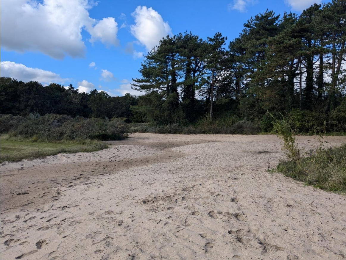
Figuur 6 - locatie 4: locatie waar rimpelroos is verwijderd. Reliëf is behouden waardoor de gradiënten behouden zijn