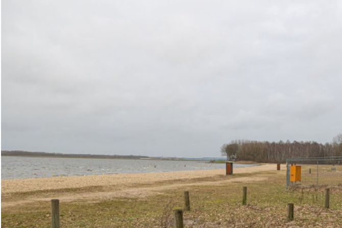
Het Stichtse Strand in Blaricum ligt er in deze wintermaanden kaal en verlaten bij.