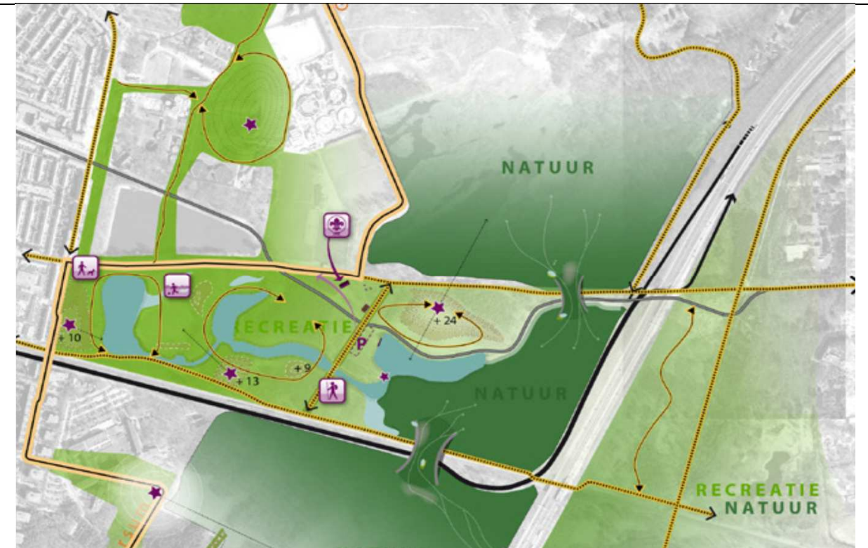
Concept inrichtingsvisie d.d. 11 juni 2014

Er zijn 15 reacties ontvangen. Hieronder staan de reacties en de antwoorden.