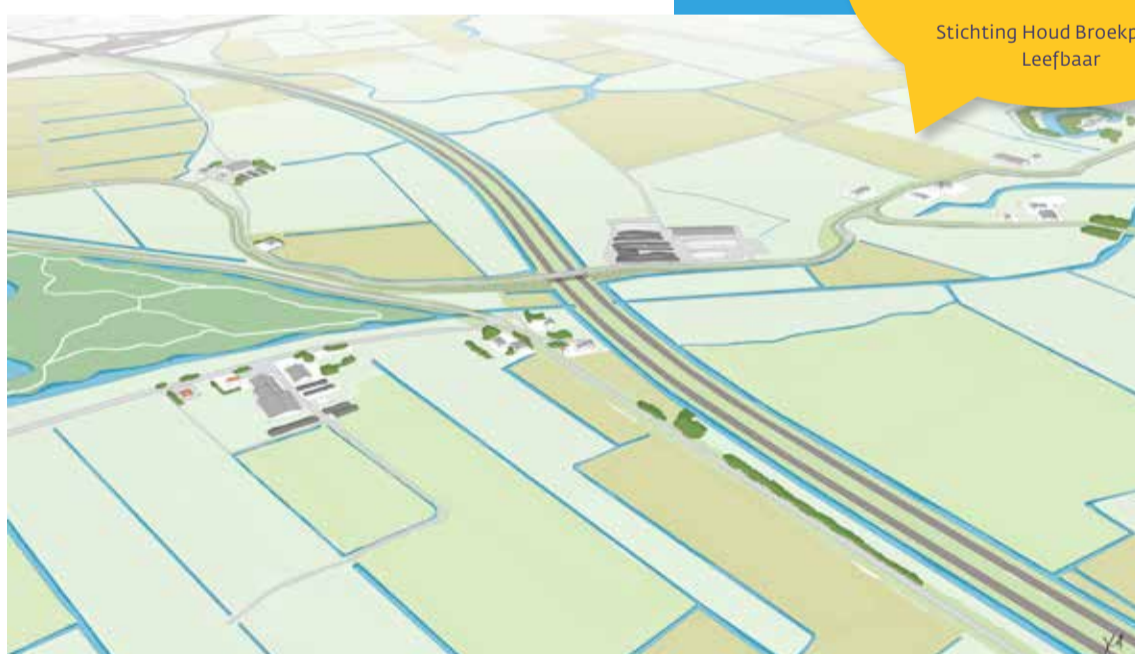
De nieuwe weg door het open veld in het Heemskerkalternatief

Het grote aandachtspunt bij de verdere uitwerking van het Heemskerkalternatief is de Stelling van Amsterdam. De nieuwe weg kruist Busch en Dam, die onderdeel uitmaakt van de dijklinie van de Stelling ovan Amsterdam. Hoe dat het beste vormgegeven kan worden, met respect voor het werelderfgoed, is onderdeel van het vervolgonderzoek. Bovendien wordt Busch en Dam veel gebruikt door agrarisch verkeer, dat niet te veel wil omrijden. Vordelen zijn dat de nieuwe weg uit de buurt blijft van Broekpolder en de golfbaan en dat er gebruik gemaakt wordt van de bestaande op- en afritten bij Heemskerk. Dat lijkt gunstig voor de verkeersdoorstroming op de A9.