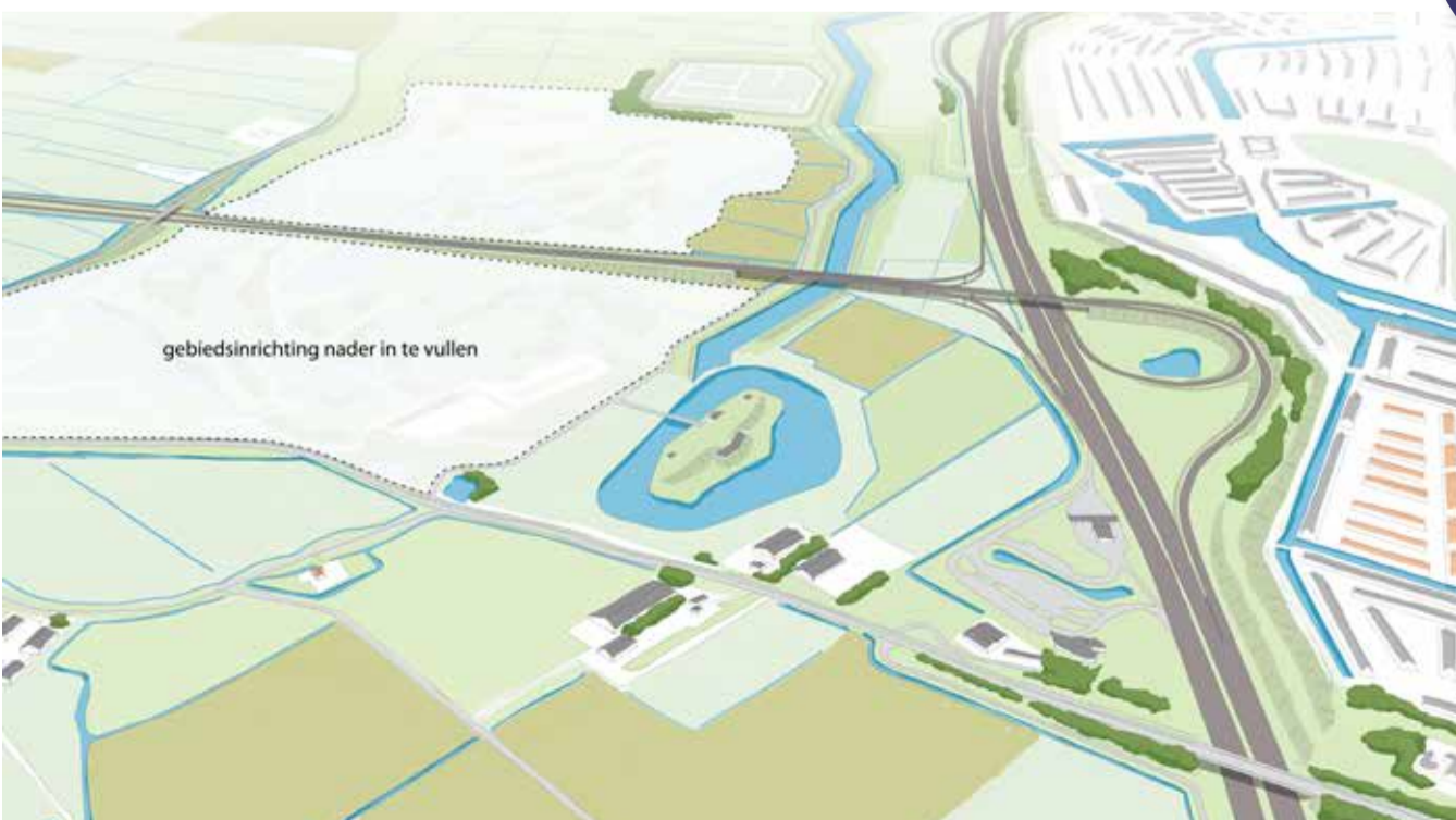
Aansluiting van alternatief 3 op de A9. Aan deze impressie kunnen geen rechten worden ontleend

Voor de aansluiting van Saendelft op de nieuwe weg, zijn nog twee opties in beeld. Via de bestaande aansluiting bij de Nauernasche Vaart of met een nieuwe aansluiting bij sportpark De Omzoom.