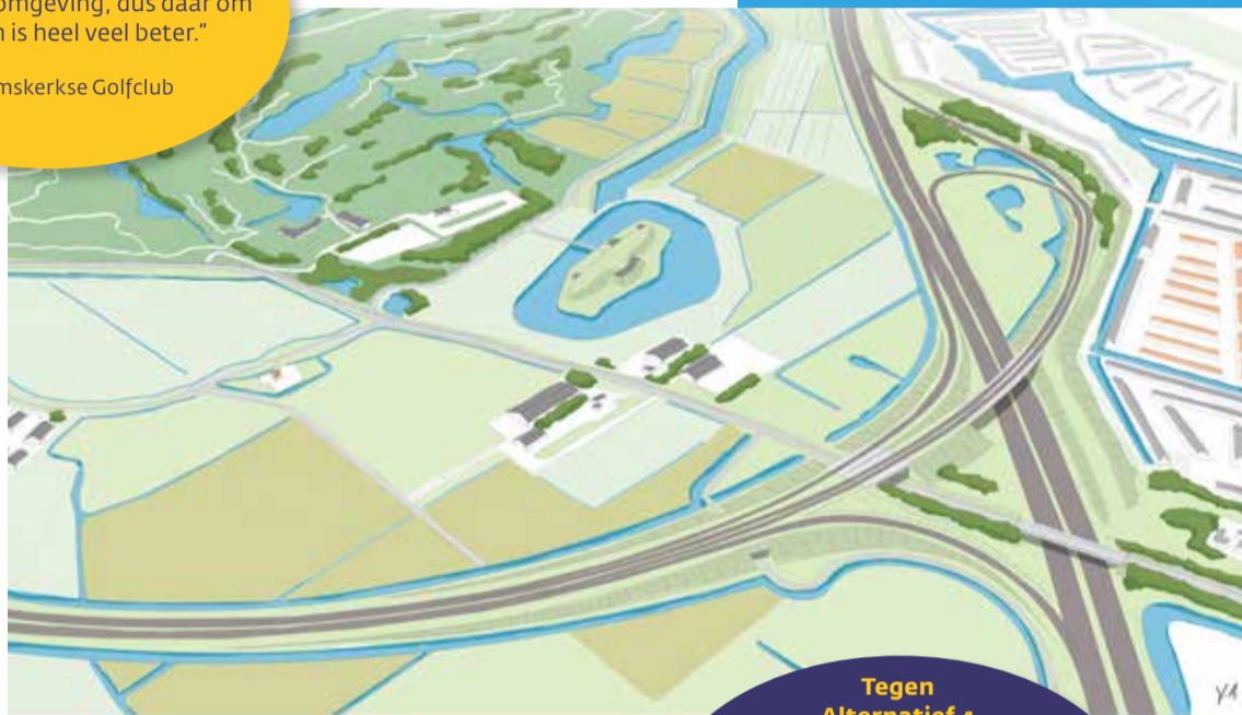
Alternatief 4 gaat met een grote boog om de golfbaan heen.

Ook bij het uitwerken van alternatief 4 zijn de kruising met de Stelling van Amsterdam en de leefbaarheidseffecten op Broekpolder belangrijke aandachtspunten. Het vrije schootsveld van fort Veldhuis, onderdeel van het werelderfgoed, wordt door de nieuwe weg doorsneden. Verder vormt de kruising met Busch en Dam een aandachtspunt. De dijk en de weg zijn onderdeel van de stelling. Bovendien