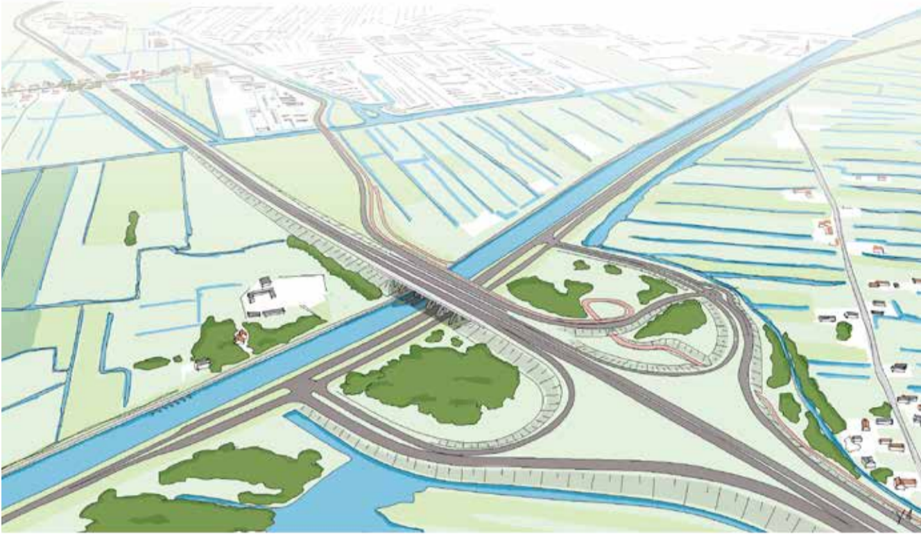
Aansluiting van de nieuwe verbindingsweg op de A8. Aan deze impressie kunnen geen rechten worden ontleend

De alternatieven 3 tot en met 7 gaan uit van een nieuwe weg om de A8 met de A9 te verbinden. Die nieuwe weg wordt een provinciale weg van twee rijbanen per richting, met een maximum snelheid van 100 km per uur.