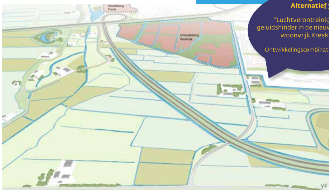
De aansluiting op de N203 is net voorbij de bebouwing van Krommenie en Assendelft. Aan deze impressie kunnen geen rechten worden ontleend