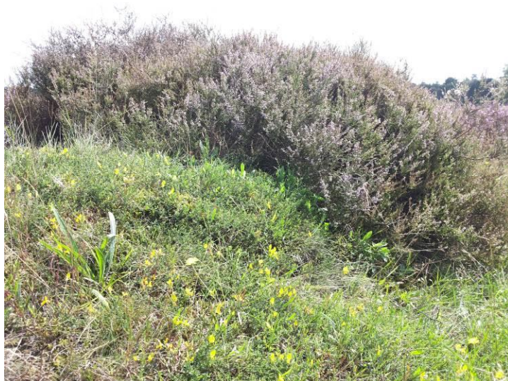
Structuurrijke heide een toekomstbeeld voor het ecoduct