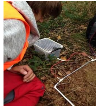
Studenten tijdens het testen van hun meetapparatuur