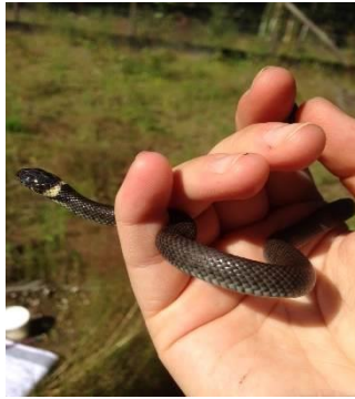
Ringslang bij een toeloop van het ecoduct

Tijdens de controles van de transecten zijn dit jaar meerdere exemplaren hazelwormen en levendbarende hagedissen op de toelopen van het ecoduct aangetroffen. Ook is de ringslang aan de oostkant van het ecoduct over de A27/spoorlijn gevonden. Op het ecoduct zelf zijn enkele waarnemingen van de levendbarende hagedis gedaan. Ook zijn dit jaar weer exemplaren van de gewone pad en de bruine kikker zowel op het ecoduct als ook op de toelopen waargenomen. Net als