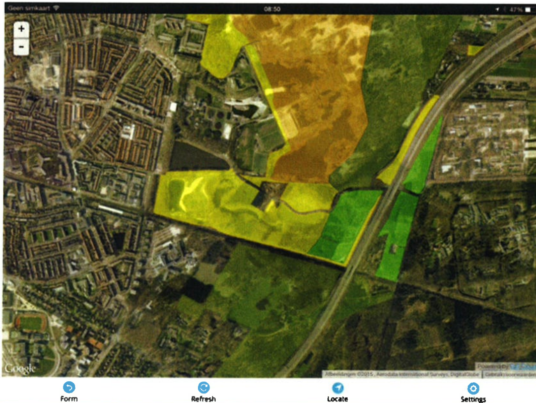
Figuur 2. Toegangsbepalingen van Anna's Hoeve en hier ten noorden van gelegen (natuur)gebied in beheer bij het GNR. Geel staat voor honden losloopgebied, in het lichtgroene (oostelijke) deel geldt een aanlijnplicht tussen 15 maart en 15 juli.

Het risico van wandelaars met hond op het functioneren van De Groene Schakel achten wij terecht. Onderzoek naar het ecologisch functioneren van ecoducten door Bureau Waardenburg (waaronder ecoduct Huis ter Heide; Emond & Brandjes, 2015) laat zien dat wandelpaden in de periferie van een ecoduct per definitie leidt tot een sterke toename van 'ongewenst medegebruik'. Met uitzondering van ree en konijn, die het ecoduct frequent passeerden/gebruikte, was de passeerfrequentie van overige zoogdieren relatief laag (waaronder boommarter). Bij Huis ter Heide was wel een verschuiving in het activiteitenpatroon van het ree zichtbaar, en beperkt tot de nachten. Dit in tegenstelling tot andere ecoducten (JP Thijsse, Nijverdalen etc.) waar reeën ook overdag actief waren om te foerageren. Het ambitieniveau van de doelsoort 'heidevogels' zal niet gehaald worden indien de huidige recreatiedruk (aantal en vorm) gehandhaafd blijft; voor deze soortgroep hebben wandelaars ook een verstoringseffect. Alleen wanneer de huidige recreatiedruk wordt teruggebracht kan de corridor fungeren als leefgebied voor deze groep.