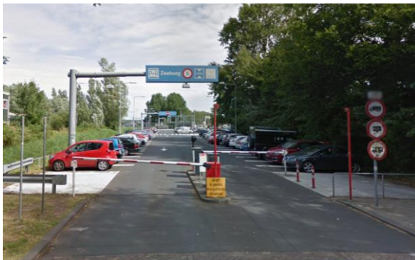
P+R Zeeburg | methode Amsterdam