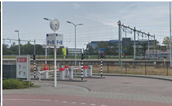
P+R Beverwijk | methode NS/Q-park