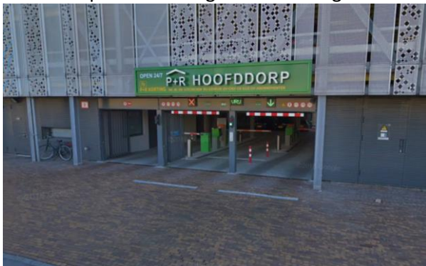
P+R Hoofddorp | P+R korting 1 e 24 uur

In Lelystad is het mogelijk om tegen een voordelig parkeertarief in de parkeergarages rondom het station te parkeren. Dit gaat via een zogenaamde parkeerbundel (abonnementsvorm).