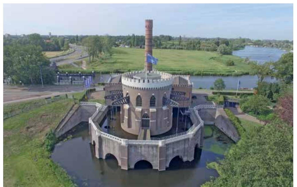
Het gemaal in de Cruquius.

De provincie Noord-Holland wil als opdrachtgever van de evenementen meer draagvlak creëren voor behoud, ontwikkeling en herbestemming van het rijke industriële erfgoed.